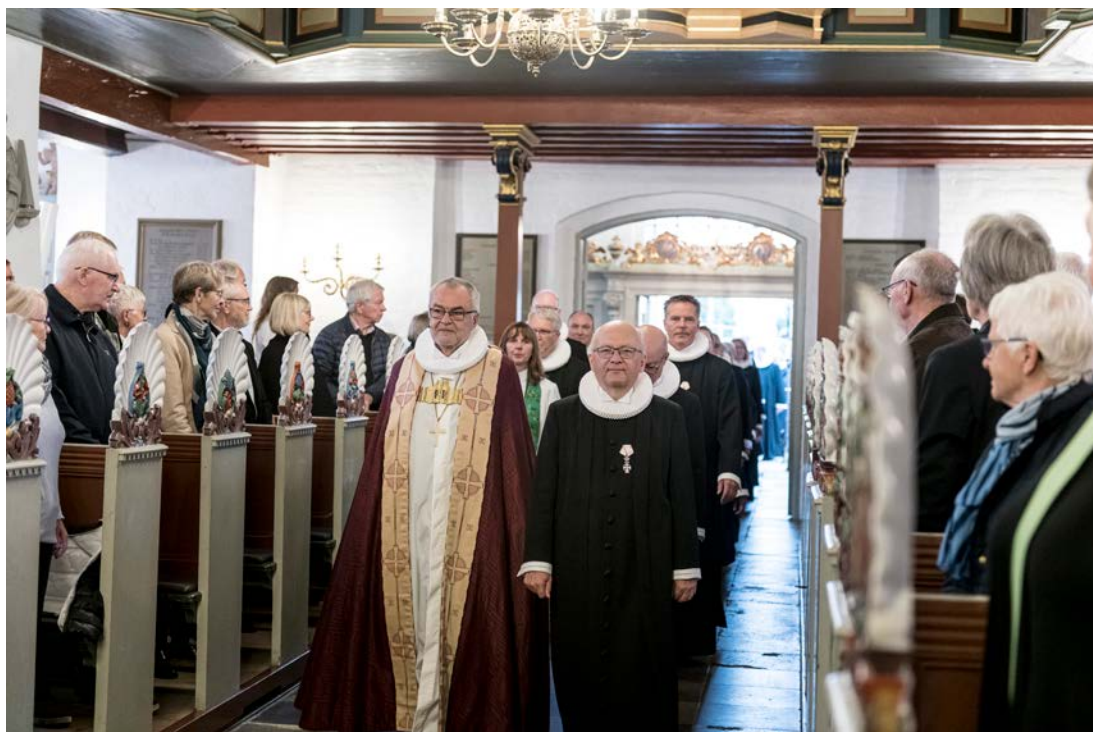
Landemode 2019.

ministeriet var alle enige om, at det var en farbar vej at gå, og forslaget blev forelagt Folketingets Kirkeudvalg.