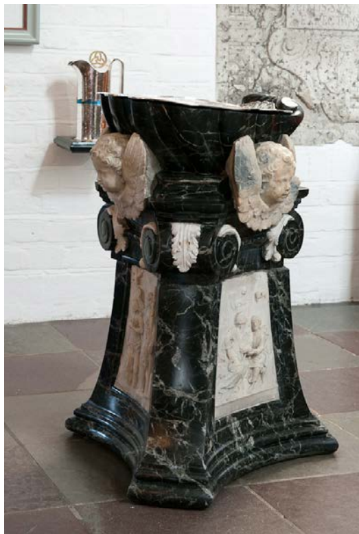
Døbefonten i Budolfi Kirke