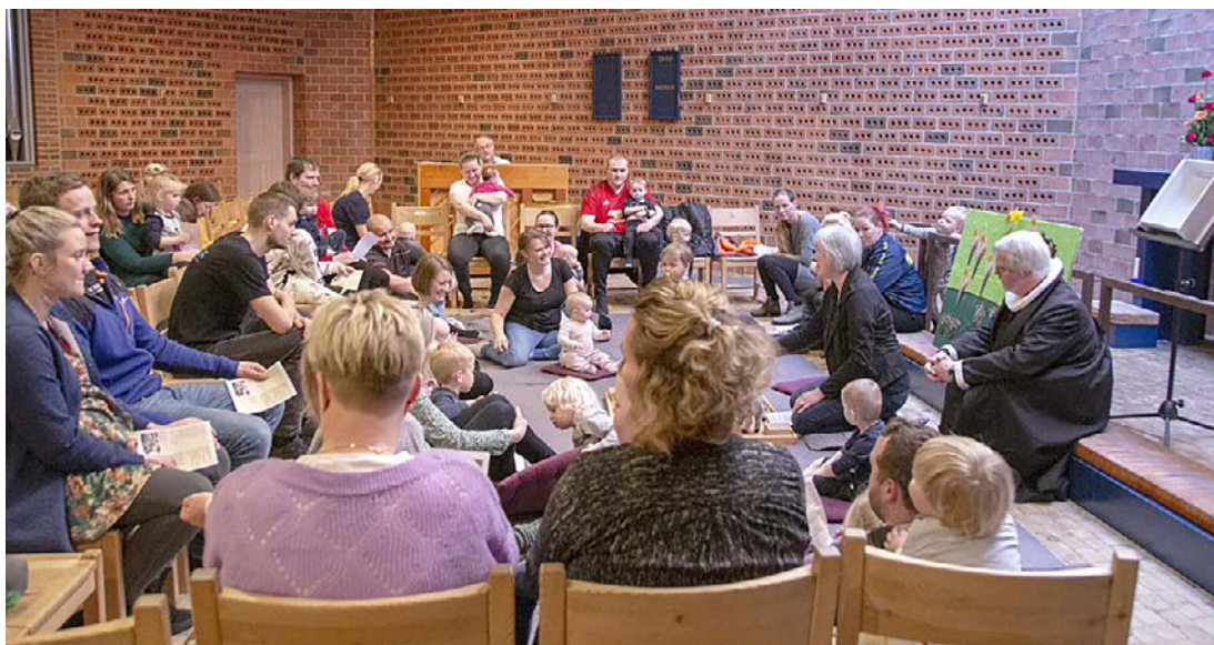
Hjørring Nordre, Børnekirke i Emmersbæk kirke.

former, der henvender sig til bestemte dele af menigheden, sådan som det f.eks. gøres i Hirtshals med børnekirke. Sammenkoblingen kan også ske i undervisningen af både unge og voksne. Bibelkundskab kan blive til livskundskab, når den formidles på en måde, der passer til deltagerens situation og behov. Allerede i Matthæusevangeliet understreges forbindelsen mellem gudstjeneste og hverdag nemlig i ordene ”idet I døber dem og lærer dem”. Sammenhængen er vigtig. Troen udtrykker sig både i gudstjenesten og i hverdagen.