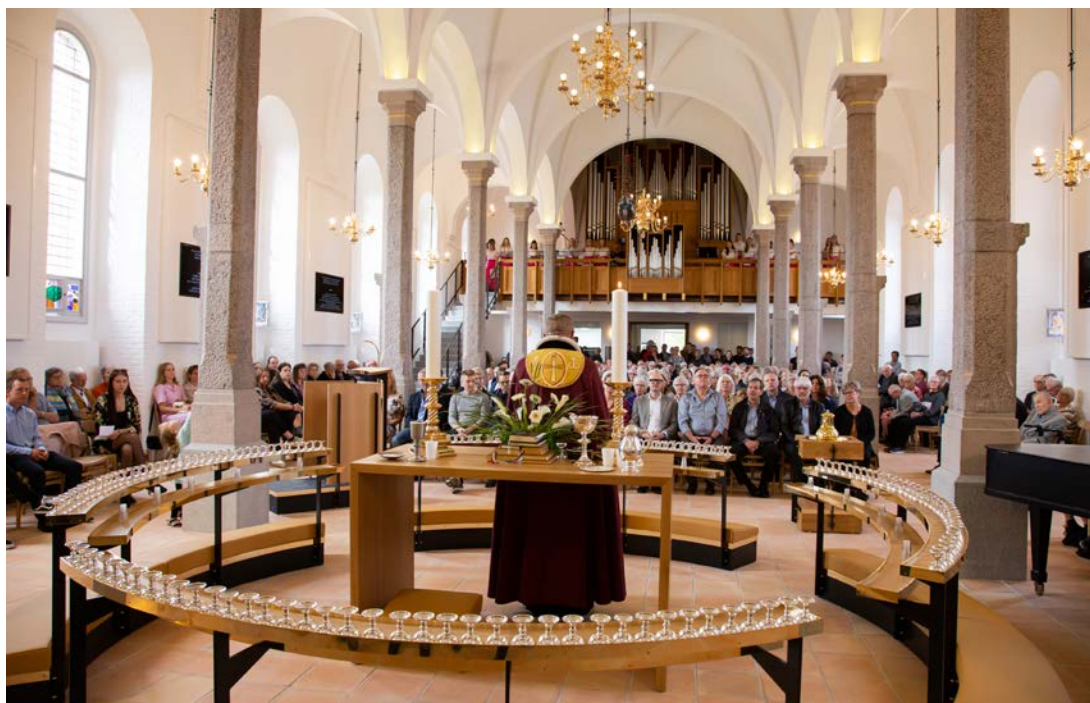
Indvielse af Brønderslev Kirke.

anlæg. Sognegården er blevet om- og udbygget, bl.a. med et centralt caféområde.