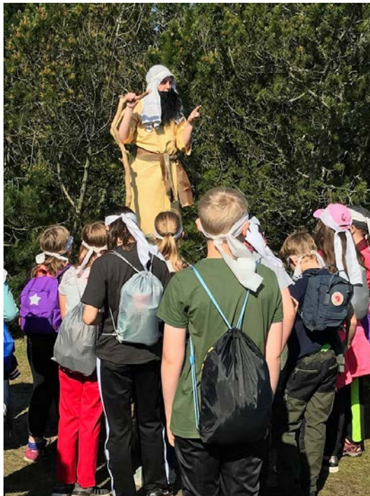
Skole-Kirketjensten – Moses i ørkenen.

I de sidste 25 år er der landet over opstået en lang række lokale samarbejder mellem skoler og kirker. I Aalborg Stift findes fem folkekirkelige skoletjenester, der dækker Frederikshavn, Hjørring, Læsø, Brønderslev, Aalborg, Thisted og Morsø kommuner, som alle er en del af et landsnetværk, der på et solidt kristendomsfagligt og religiondidaktisk niveau udvikler samarbejdet. Det er de lokale forhold i de enkelte provstier, som definerer og bestemmer, hvordan