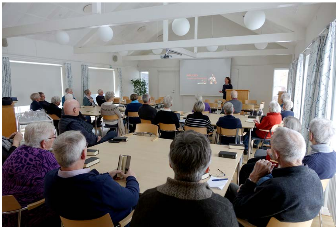
Hjørring Nordre, Kristendom i bund og grund.

andet end almindelig nysgerrighed og interesse. Således er deltagereskaren også bredt sammensat af både mænd og kvinder med vidt forskellig kirkelig baggrund – eller for den sags skyld ikke nogen. Det giver spændende samtaler over kaffen – og ude i garderoben bagefter, mens man tager jakken på og ønsker hinanden en god weekend og måske på gensyn på søndag i kirken.