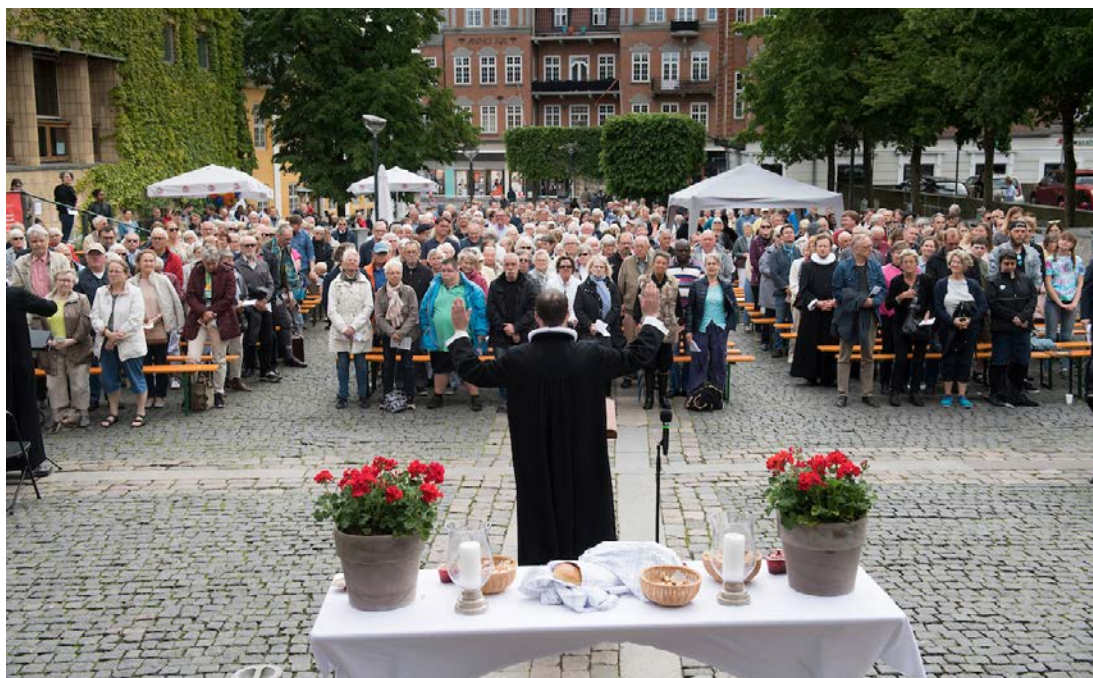
Friluftsgudstjeneste på torvet i Aalborg.

Omsætter vi tallet til Aalborg Stift vil der altså være omkring 25.000 mennesker, som ifølge undersøgelsen er interesseret i menighedsrådsarbejdet. Det burde give os alle mod på at gå ud i sognene og indlede en dialog med disse mennesker. Opfordre så mange som muligt til at gå ind i menighedsrådsarbejdet og opfordre til at stille