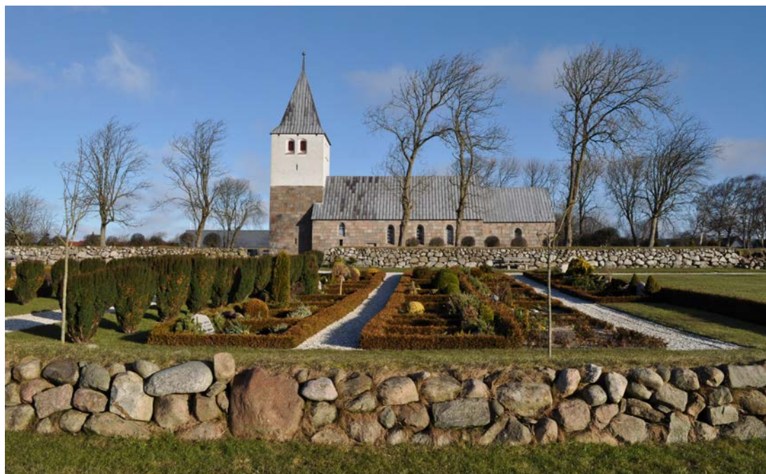
Nors Kirke, set fra syd med den nyeste kirkegårdsafdeling i forgrunden.

Det tager selvfølgelig tid at implementere en udviklingsplan – det drejer sig om årtier, men for graverne er Udviklingsplanen allerede nu et nyttigt arbejdsredskab i hverdagen – f.eks. i forhold