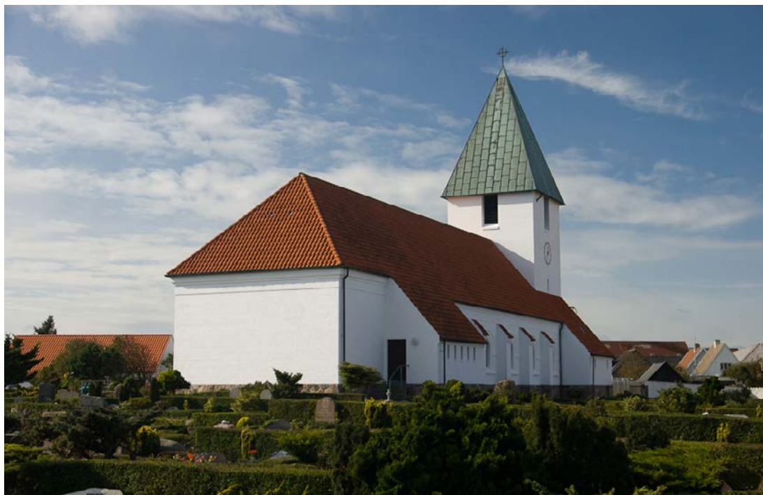
Hirtshals kirke.

Et flagskib i stiftets ungdomsarbejde er projekt Hvad er meningen? i Folkekirkens Hus. I år er 3. gang, at Aalborg Universitet, Nordjyske gymnasier og Aalborg Stift går sammen om projekt Hvad