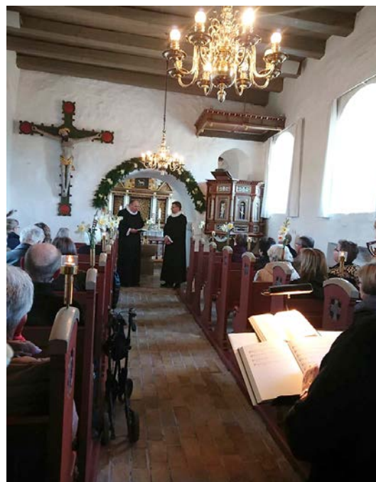
Indsættelsefest i Vrå Sognegård, april 2019.