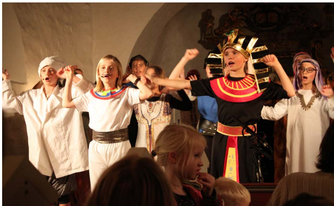
Jammerbugt Børnemusical 2018.

Der er en stor tilstrømning af nye beboere til de større byer – i Nordjylland selvfølgelig Aalborg især, men selv i lille Jammerbugt kan vi mærke, at