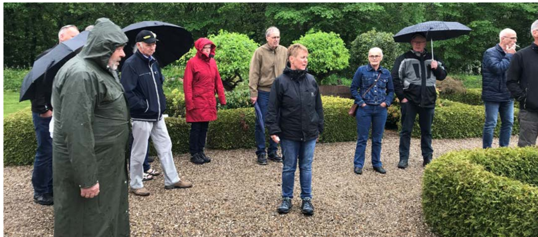
De dødes haver.

Over et år har Lundby kirke været lukket p.g.a. renovering. Der har været en del benspænd undervejs, hvor kirken har fået nyt tag, er blevet kalket indvendigt og har fået nyt varmeanlæg. Desværre kom maleren til skade, og en anden maler kunne ikke findes, så opfriskning af kirkebænke må vente til 2020, hvor maleren forventes raskmeldt. Men kirken blev alligevel taget i brug igen den 23. juni, hvor menigheden samledes til gudstjeneste.