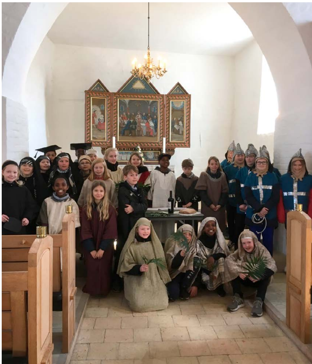
Skole-Kirketjenesten. Via Dolorosa.