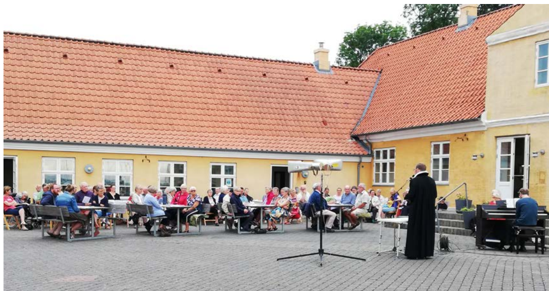
Morgensang i Doverodde Købmandsgård.

Menighedsrådene sørgede for plakater, annoncering og et sanghæfte. Vejret var en nogenlunde