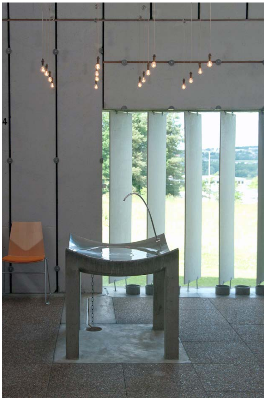
Døbefont Gug kirke.