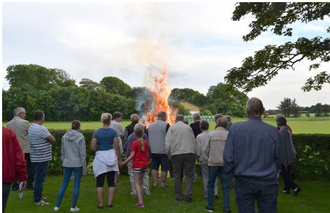
Sct. Hansaften i Vrejlev præstegårdshave

Udvalgenes rapporter er udkommet her i foråret sammen med fire letlæselige foldere. Det er planen, at man i menighederne skal debattere disse og gerne sætte dem på ved menighedsråde-