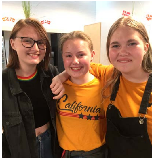
Påske på Voergaard.