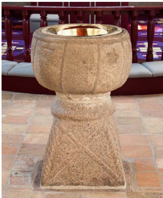
Døbefonten i Tårs kirke.

Det prøver udvalget at kvalificere, og der er som sagt udgivet tre store rapporter samt fire læse-let-udgaver, som alle kan skaffe sig via henvendelse til den lokale kirke eller på nettet. Alle indbydes til en drøftelse, og man kan sende sine overvejelser ind. På baggrund af dette vil biskopperne beslutte, om der skal nedsættes en egentlig liturgikommission. Så bare bidrag til debatten. Der er sker noget.