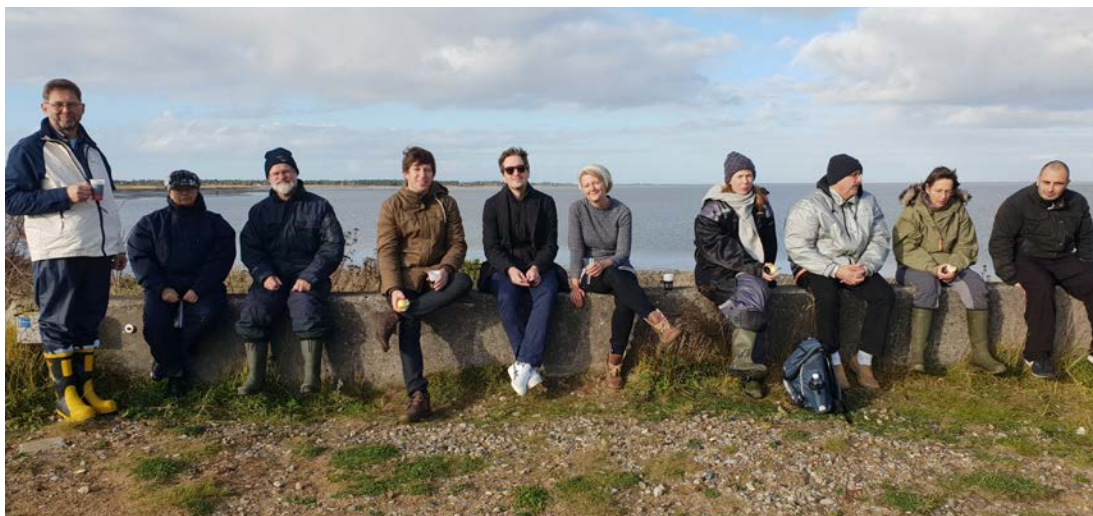
Præster på studieuge, kaffepause.

Ikke at man så bare kan lade stå til – for som bekendt: Det er kun ukrudt og lommeuld, der kommer af ingenting! I Morsø provsti sætter man sig ned og taler sammen om, hvordan vi kan være kirke, her hvor vi er – i sognet, i pastoratet og i provstiet. Derfor fægter man ikke i blinde; men prøver nye ideer af og puster liv i de gamle (hvis de stadig er relevante). Man samarbejder på tværs af grænser – og sætter samtidig en ære i at holde det lokale i live.