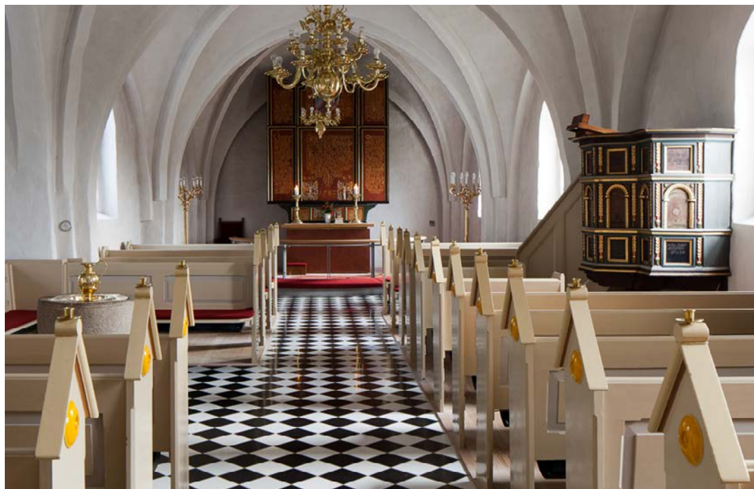
Det indre af Mou kirke.

Landsforeningen af Menighedsråd, Grundtvigsk Forum og Biskopperne har udarbejdet