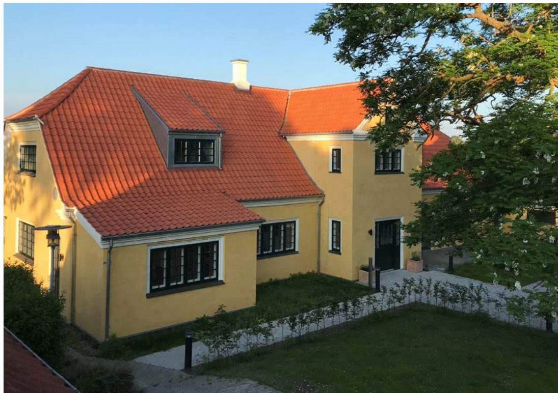
Nye rammer for provstikontoret.

Der er noget forfriskende over Aalborg Stift, som man tydeligt oplever, når man kommer her til. Her er højt til loftet, kirkeligt set stor spænd-