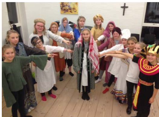
Jammerbugt Børnemusical 2018.

For Folkekirken er mange steder en naturlig del af lokalsamfundet. Der er gang i samarbejdet med borger- og idrætsforeninger, og kommunen vil også gerne være med, f.eks. i samspillet med den lokale kirke om hjælp til udsatte børn og familier, som regel også sammen med andre medspillere som Rotary, Lions og Røde Kors eller KFUM og KFUK’s sociale arbejde. Samtidig er der rundt om i provstiets mange sogne god gang i forskellige nye og gamle tiltag, som babysalmesang, børnebongo og børnemusicals sammen med både minikonfirmander og almindelige