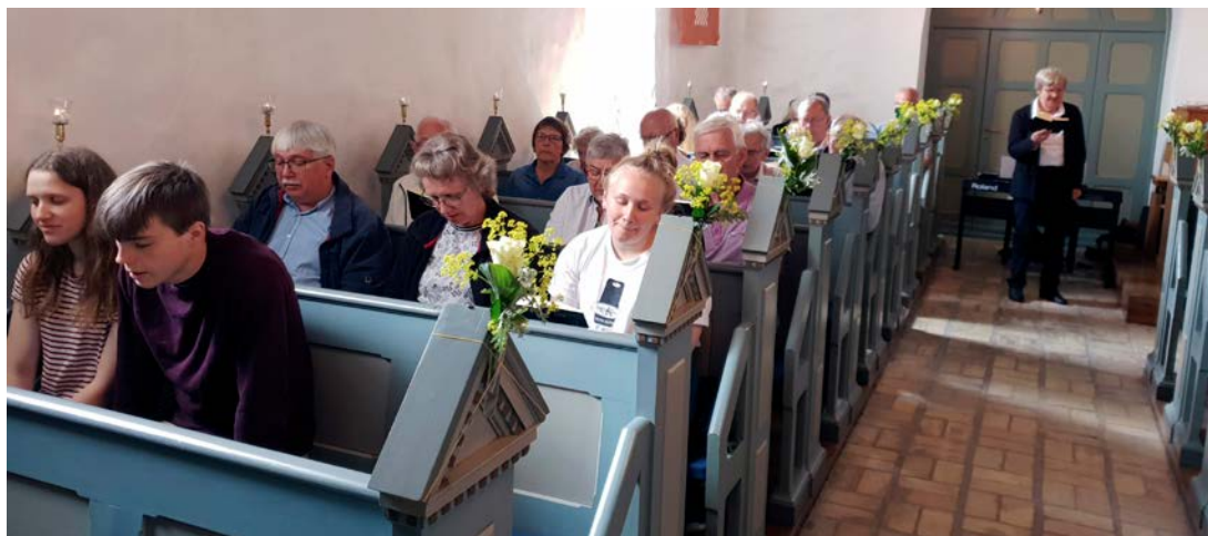
Så holdes der igen gudstjenester i Lundby kirke.