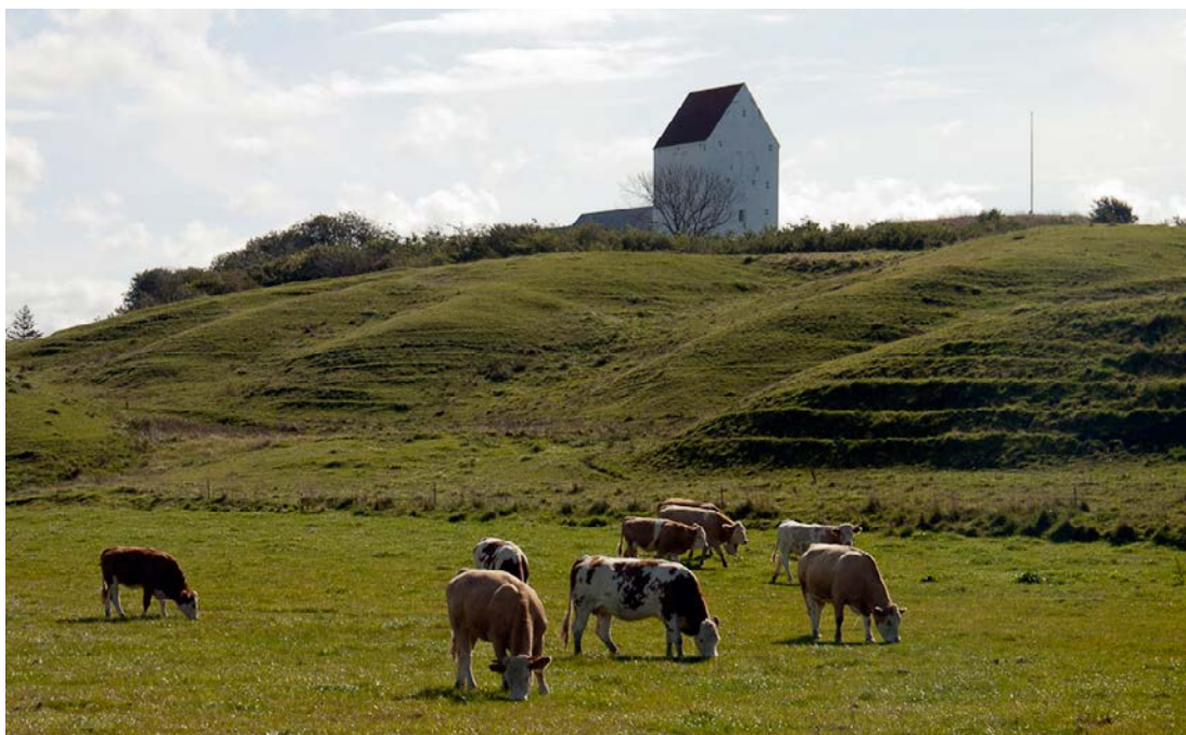
Vennebjerg kirke.

Området trænger i hvert fald til at blive belyst, og det kalder på et engagement fra alle gode kræfter, som kan se vigtigheden af at involvere og