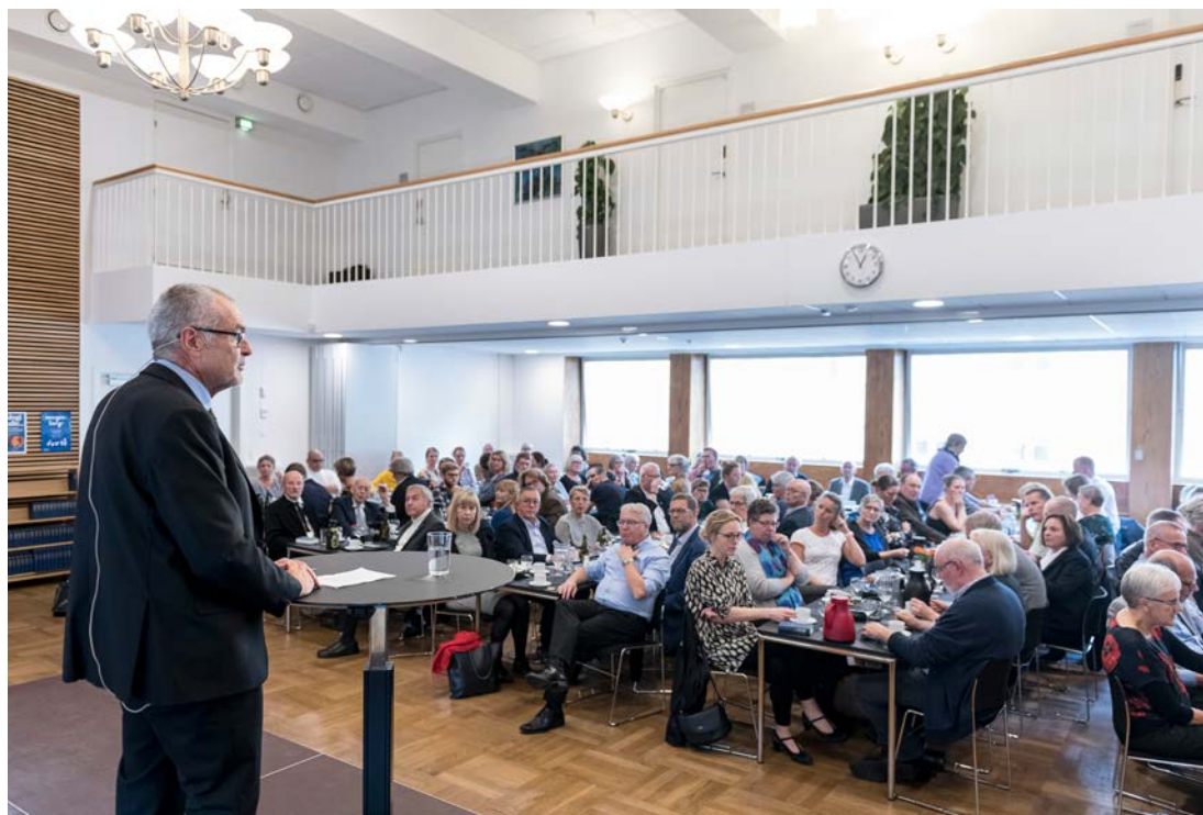
Biskoppen aflægger landemodeberetning 2019.

Dåben understreger, at vi alle er lige for Vorherre. I barnedåben bliver det åbenbart, at vi ikke kan gøre os fortjent til Guds nåde og retfærdighed. Vi får begge dele ufortjent og gratis. Vi får det af nåde.