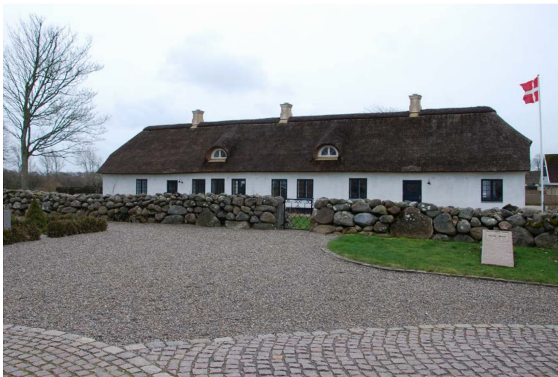
Sejerslev præstegård istandsat – marts 2019.