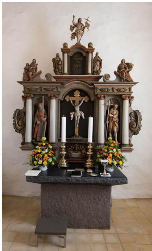
Nyt alterbord i Sønderup kirke.